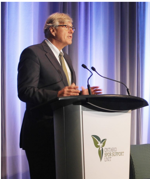
Le D r Bob Bell, sous-ministre de la Santé et des Soins de longue durée, fait une présentation au rendez-vous de l'USSO le 12 juin 2015.

L'Unité de soutien de la stratégie de recherche axée sur le patient (SRAP) de l'Ontario tenait son rendez-vous inaugural les 11 et 12 juin au District de la découverte MaRS, à Toronto.